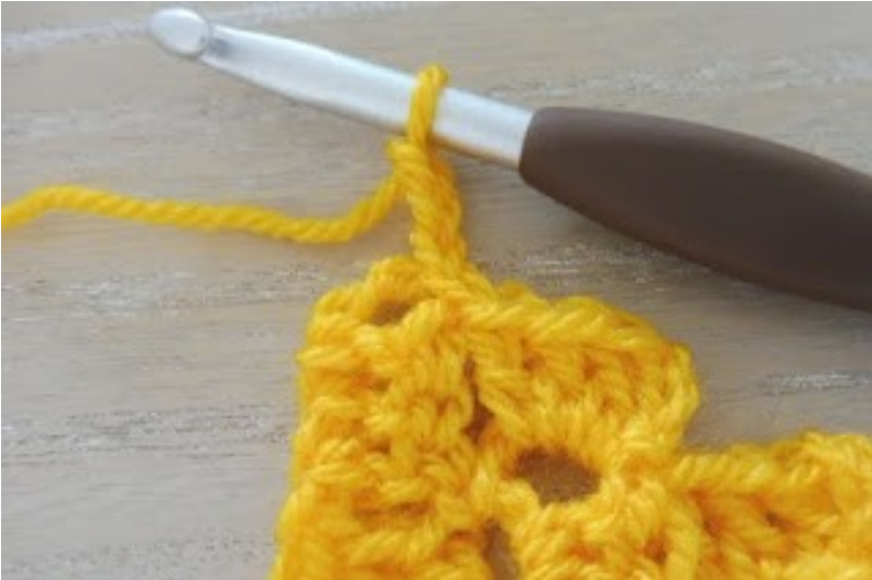
Haak 3 lossen