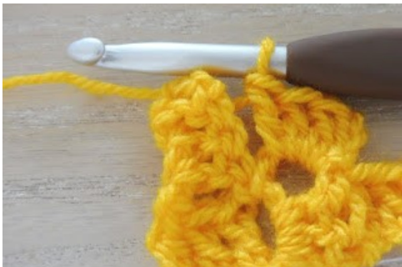
en 3 stokjes in de lossenboog