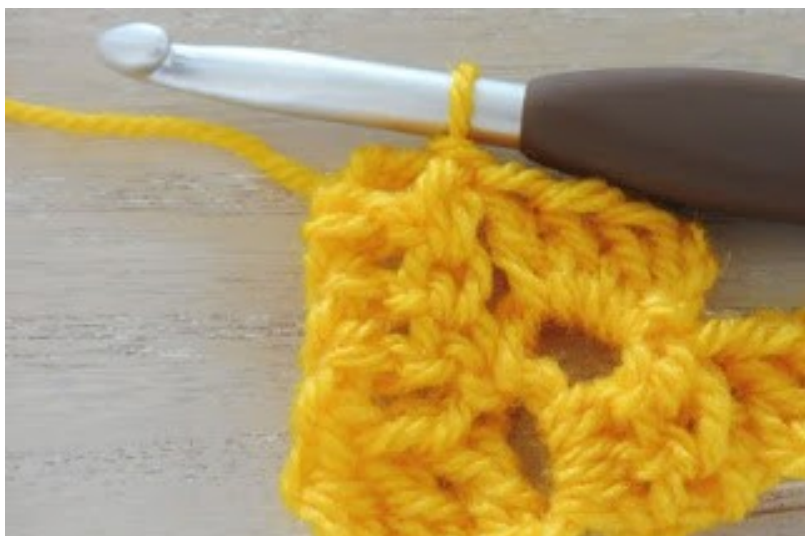
Haak 1 halve vaste in de aangrenzende lossenboog