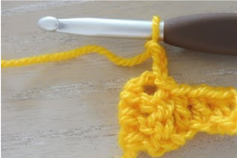
Haak 3 lossen