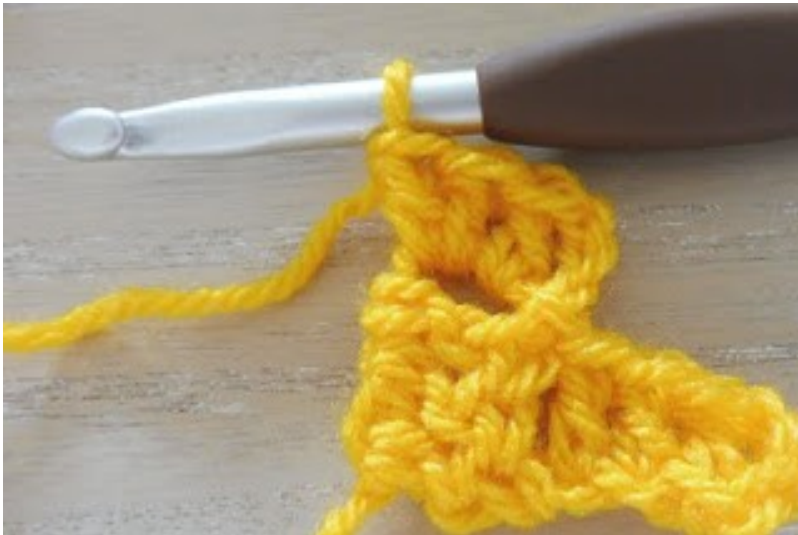
Haak 3 stokjes in de lossenboog en je tweede rij is af.