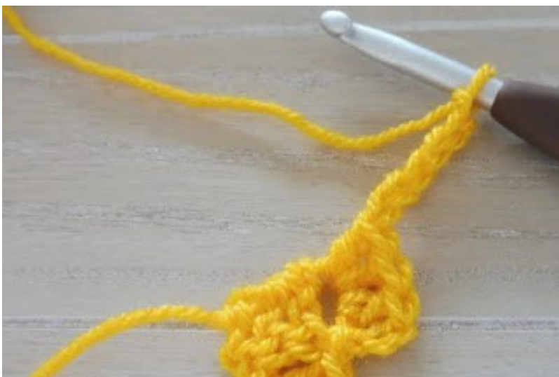
Haak 6 lossen