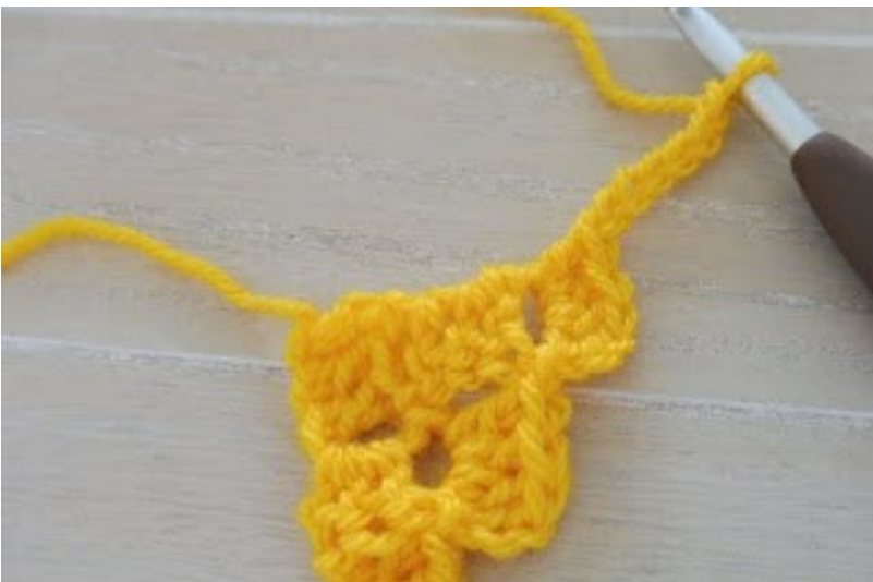
Haak 6 lossen