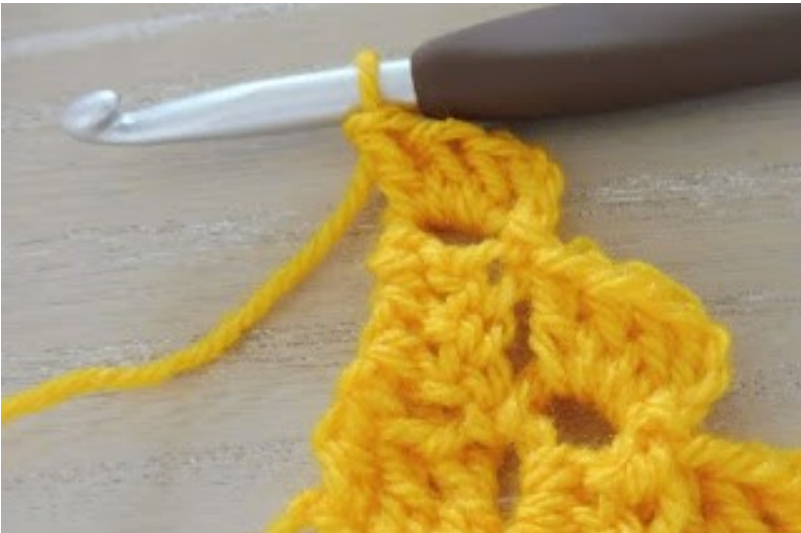
en 3 stokjes in de lossenboog en rij 3 is af.