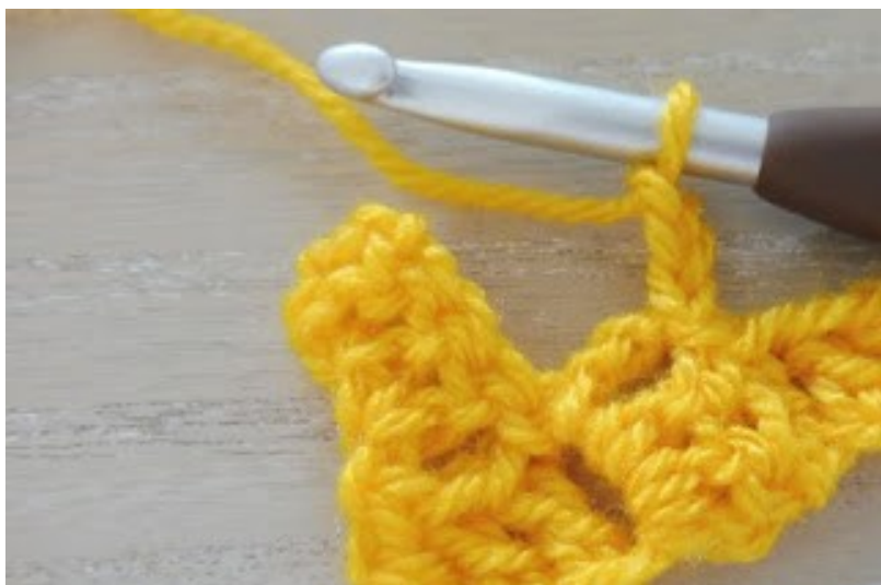
Haak 3 lossen